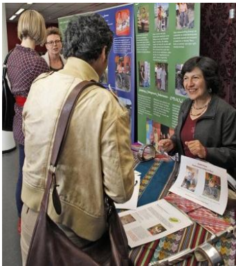
Te gast bij het MKB.