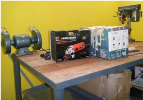
Werktafel en gereedschap.

Naast de aanschaf van gereedschappen en werkmateriaal was er behoefte om de leerwerkplaatsen te voorzien van aangepaste werktafels en werkbanken. Vrijwilligers hebben geholpen bij het op maat maken en in elkaar zetten van de banken en tafels.