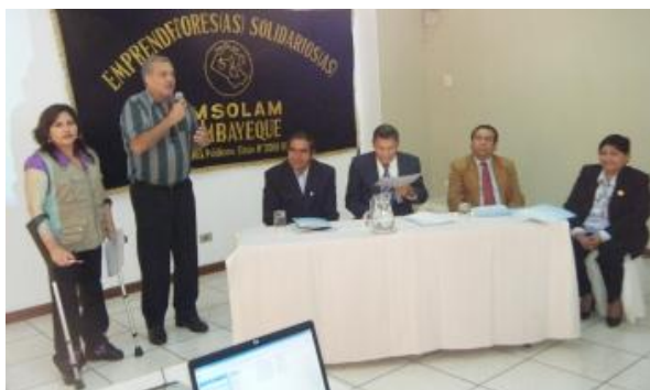
Presentatie 'good practices'.

EMSOLAM heeft haar ervaring van de afgelopen jaren gebundeld en de projecten 'vakopleiding orthopedische hulpmiddelen' als 'good practices' gepresenteerd. Dit document wordt door EMSOLAM ingezet als lobby- en bewustwordingsdocument. EMSOLAM constateert dat het heel belangrijk is een goede analyse te maken van de problemen die mensen met een handicap in de regio ervaren. De vakopleiding blijkt goed aan te sluiten bij de behoefte aan werk én orthopedische hulpmiddelen. Tijdens de vakopleiding is EMSOLAM in gesprek gegaan met overheidsinstanties. Ook heeft EMSOLAM voorlichting gegeven in de regio en legde daarmee een basis voor steun van overheidsinstellingen en maatschappelijke organisaties in de vorm van het ter beschikking te stellen van lokalen voor de leerwerkplaatsen. Een andere vorm van steun is de erkenning van de opleidingen door de betrokken ministeries.