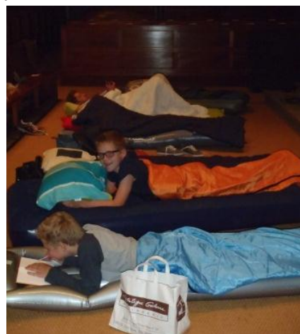
Slaapactie in de kerk.

De jongerengroep bedacht allerlei activiteiten om geld in te zamelen voor onze stichting. Zo hebben ze zelf koekjes en cake gebakken en verkocht aan de kerkgangers; ze deden allerlei karweitjes tegen betaling. Ook hebben zij een nacht doorgebracht in de kerk en lieten zich daarvoor sponsoren.