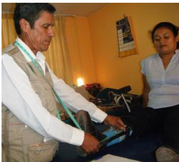
Aanmeten van beenbeugels.

De intentie hiervan was een goede basis te leggen voor het opstarten en runnen van een eigen orthopedische werkplaats in de nabije toekomst. Tijdens praktijklessen verdiepten de deelnemers zich in de vaardigheden voor het maken en repareren van orthopedische hulpmiddelen. Daarnaast gaf een docent van het managementinstituut IPAE een training over ondernemersvaardigheden. Wat is nodig om een leerwerkplaats met succes te starten en welke vaardigheden zijn nodig om een werkplaats met succes te runnen? De deelnemers zijn aan de slag gegaan met onderwerpen als het verrichten van marktonderzoek en het maken van een ondernemingsplan.