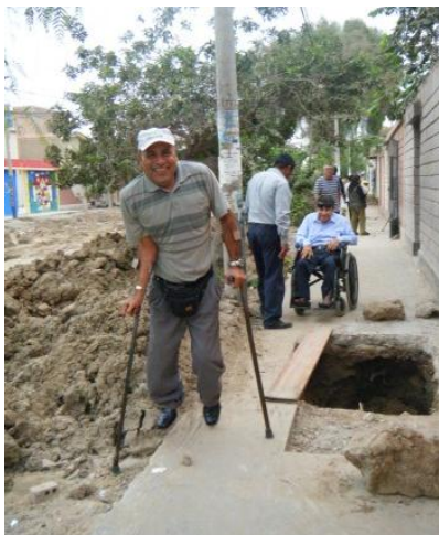
Deelnemers op weg naar de training.

De straat voor het lokaal van EMSOLAM, waar ook de ondernemerstraining en de praktijklessen plaatsvonden, is ruim een half jaar opengebroken geweest. Dit bracht voor de bestuursleden van EMSOLAM en de deelnemers erg veel ongemak en enig oponthoud met zich mee, maar het heeft hen er niet van weerhouden om de activiteiten voort te zetten.