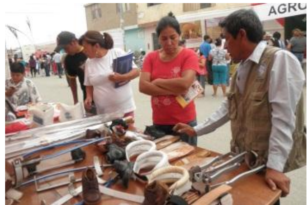
Promotie producten op de feria.

Tijdens lokale en regionale markten en conferenties werden de diverse producten van de leerwerkplaatsen gepresenteerd.